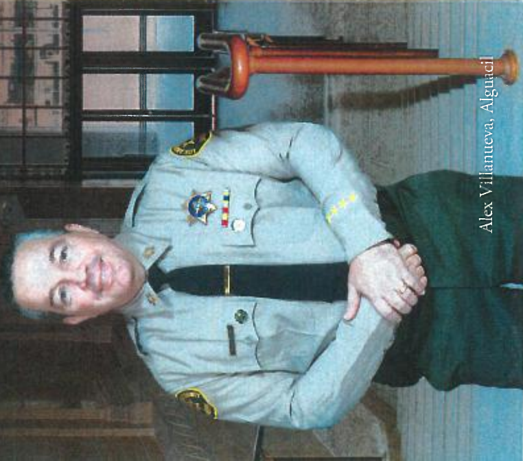
Alex Villanueva, Alguacil

¡Ganamos la confianza pública día a día!